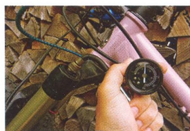
60 ZÁKLADNÍ NASTAVENÍ ODPRUŽENÍ Pro bezpečí i pohodlí