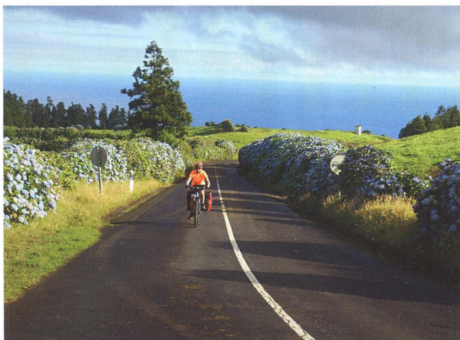
18 ZAHRANIČNÍ CYKLOTRASA Květinové Azory São Miguel, Pico a Terceira