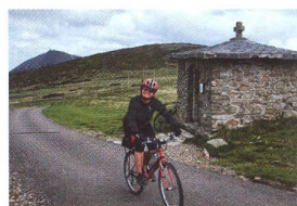
44 KOLEM VLASTI Krakonoš a jeho dvě Labe