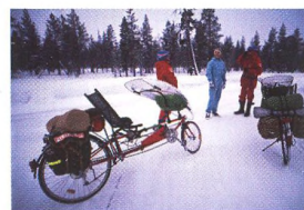
70 Z JINÉHO POHLEDU V zimě na lehkokole k Nordkappu