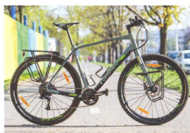
76 CELÝ MĚSÍC V MĚSTSKÉM PROVOZU Giant ToughRoad SLR1 nejen pro drsné cesty