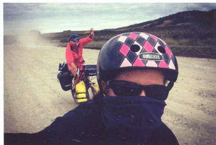
36 ROZHOVOR Jihoamerická cesta za svobodou a poznáním