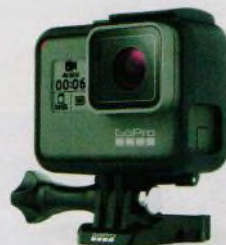
Univerzální kamery pro akční videozáběry (str. 22–25)