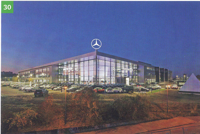
DGNB-zertifiziertes Autohaus für Neu- und Gebrauchtwagen