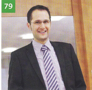
Ende der fiktiven Mängelbeseitigung