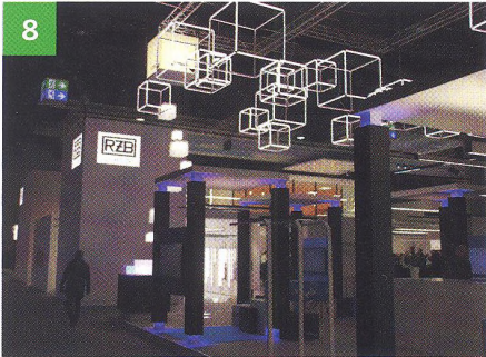
Die Light+Building 2018 – Teil 2