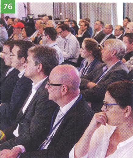
4. Leading Air Convention