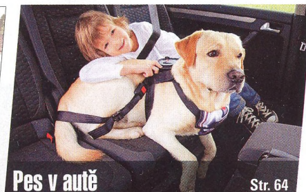
Pes v autě