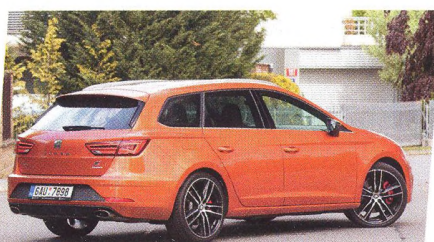
Seat Leon Cupra