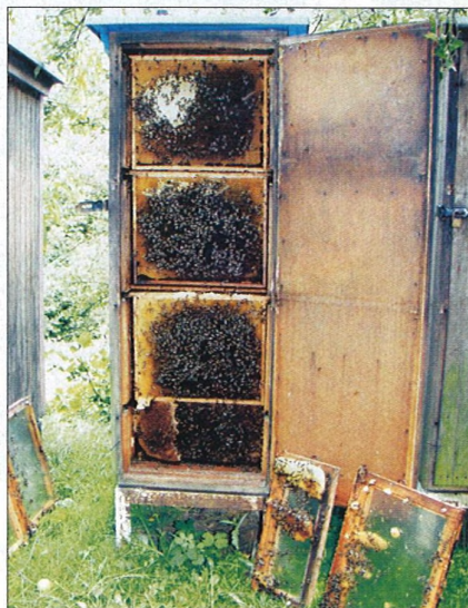
Otevřený ekonom po odejmutí okének.