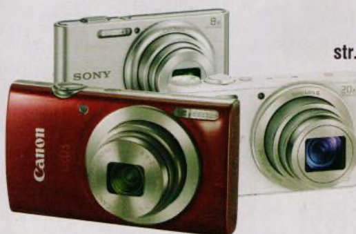
Na stranách 20–25 najdete přehled nejlevnějších kompaktních fotoaparátů