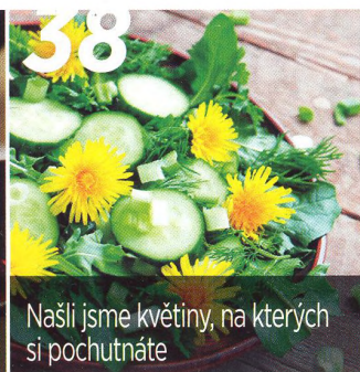
Našli jsme květiny, na kterých si pochutnáte