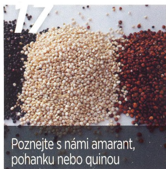
Poznejte s námi amarant, pohanku nebo quinou