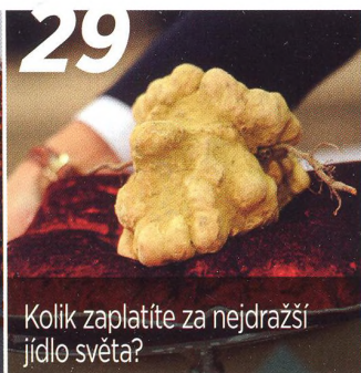
Kolik zaplatíte za nejdražší jídlo světa?