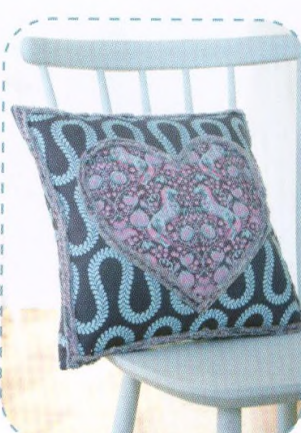
Polštářek se srdcem, strana 72