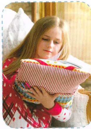
Polštářek na čtení, strana 50