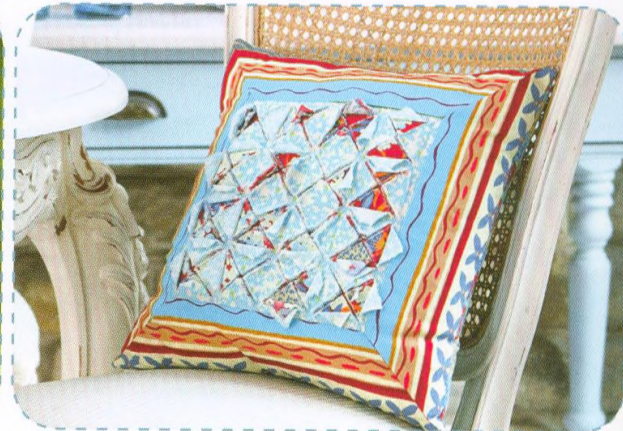
Prořezávaný potah na polštářek, strana 20