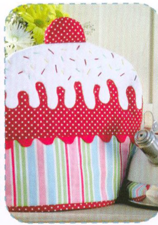
Poklop na čajovou konvičku, strana 86