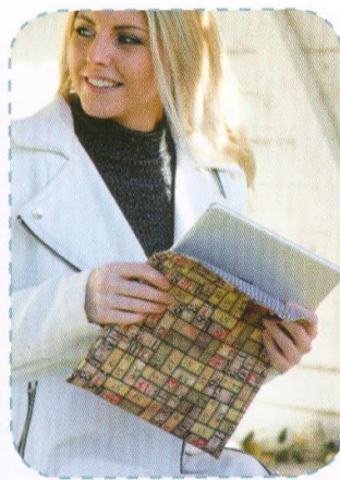
Obal na tablet, strana 82