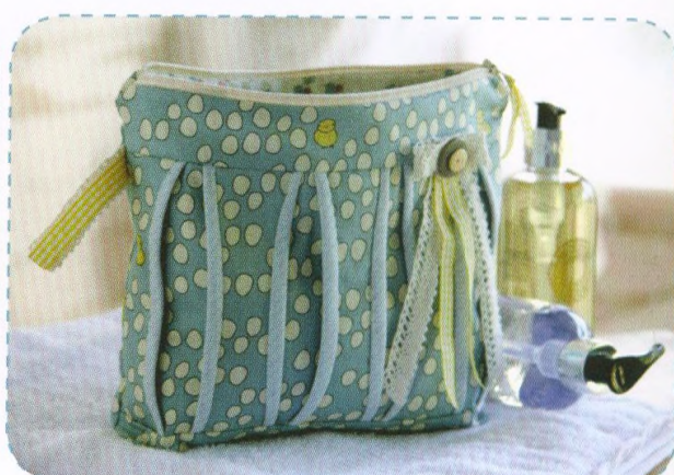
Kosmetická taštička, strana 40