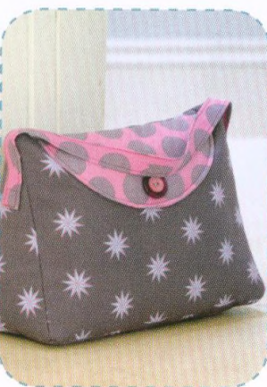
Kabelková zarážka do dveří, strana 64