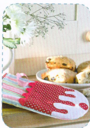
Muffinová kuchyňská chňapka, strana 68