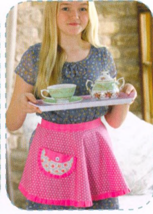
Dětská zástěra, strana 56