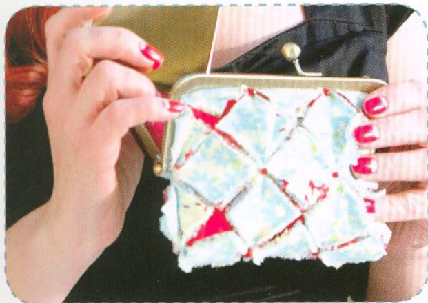
Prořezávaná kabelka, strana 24