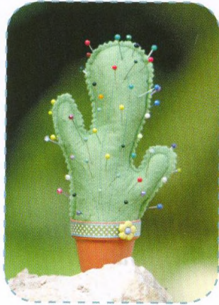
Kaktusový jehelníček, strana 18