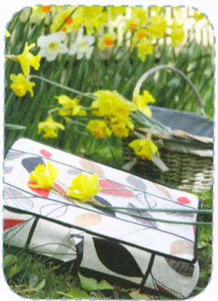
Klekací podložka na zahradu, strana 60