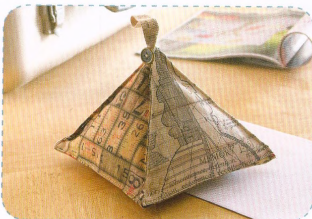
Pyramidové těžítka, strana 38