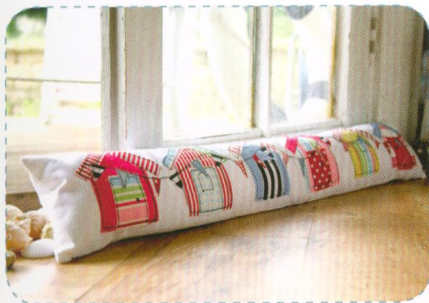
Průvaník, strana 46