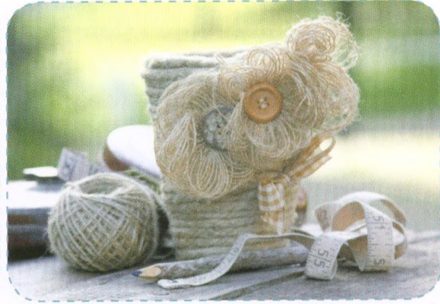
Rustikální květináč, strana 30