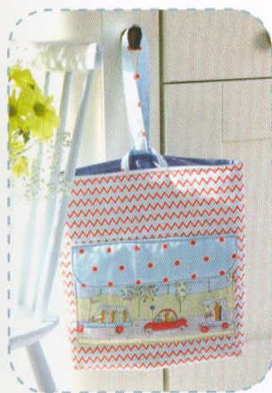
Závěsný organizér, strana 78