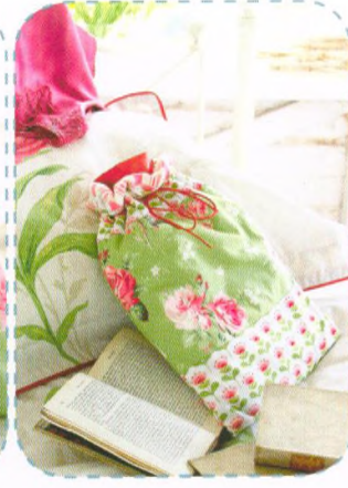
Obal na termofoar, strana 94