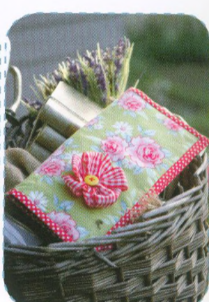
Peněženka, strana 74