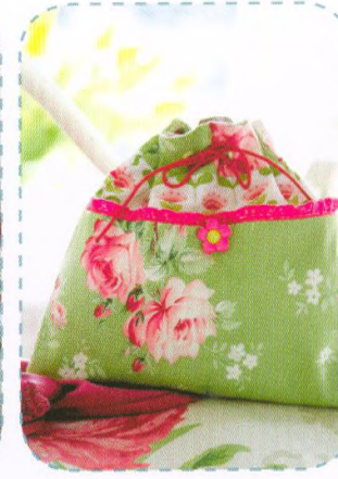
Pytlík na pyžamo, strana 90