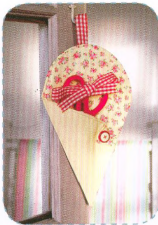
Pouzdro na nůžky, strana 28