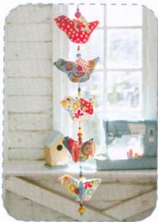
Ptáčky na šňůrce, strana 34