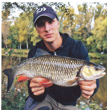
26 Velcí tlouští / cílený lov přívlačí