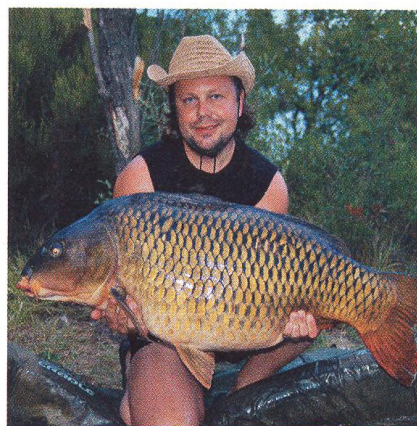
8 Jak na kapry v létě