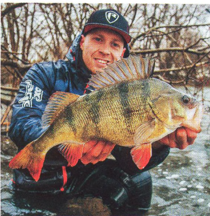
22 Kick Back Rig / systém, který sedí