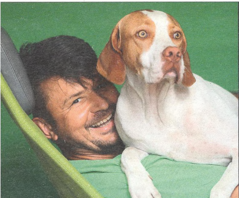
VÁCLAV JIRÁSEK fotograf

„Lidé pohanství vnímají jako jakýsi návrat domů, jako něco, co tady bylo vždycky a my to jen znovu objevujeme.“