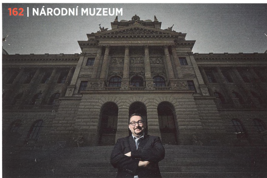
162 | NÁRODNÍ MUZEUM