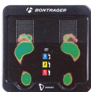
56 ANATOMICKÉ STÉLKY DO BOT Nohy v nadstandardu