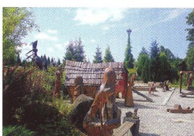
42 VÝLETNICKÝ PELMEL Záhadné kameny, poutní areál, opevnění, expozice