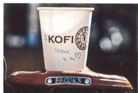
60 Z JINÉHO POHLEDU Nákladní kola vončí kávou