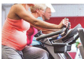
48 SPRÁVNÁ VÝŽIVA – SKRYTÝ MOTOR NA KOLE Kolo, těhotenství a správná výživa? Jde to!