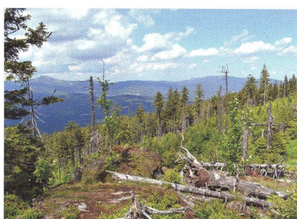
36 DOMÁCÍ VÝŠLAP Velký Falkenstein a Pancíř – hora tří řek