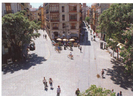
16 ZAHRA NIČNÍ REGION Valencie všech chutí a zájmů