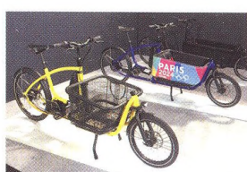
52 ZÁBLESKY Z EUROBIKU Trendy byly gravel biky a nákladáky