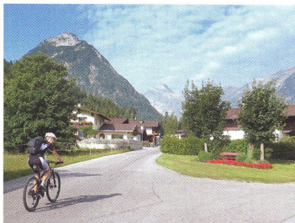
22 NA KOLE I S KOLEM (NEJEN PO ALPÁCH) Poklady nad „stříbrným“ Achensee