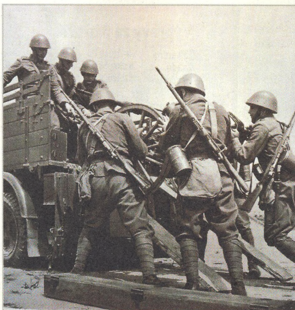
↑ Vůle bránit se proti útoku nacistického Německa byla v září roku 1938 obrovská (str. 26)