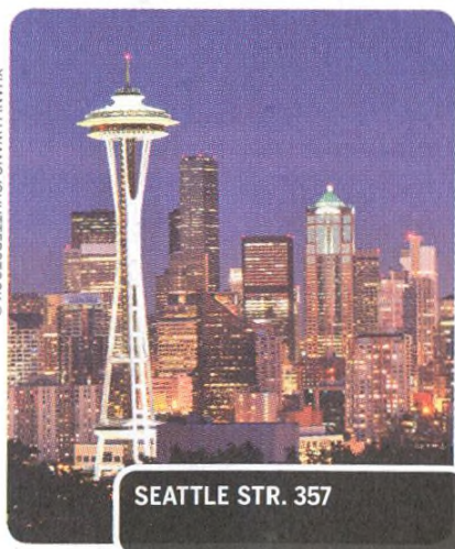
SEATTLE STR. 357