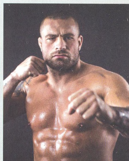
28 Karlos Vémola - zápasník MMA