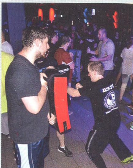
56 Umíte bojovat v baru?