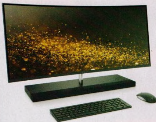
Úsporné počítače schované v monitoru (str. 12–16)