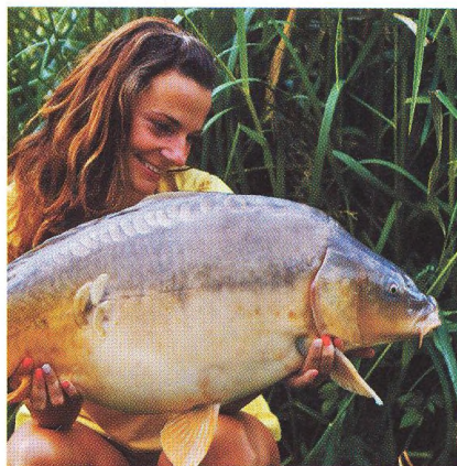
12 Volba krmení / aneb ne vždy snadné rozhodnutí