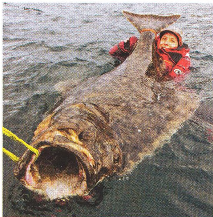
04 Havøya / za halibuty na konec kontinentu