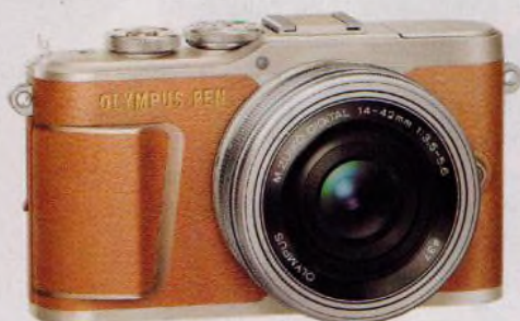
Fotoaparáty pro náročnější fotoamatéry (str. 22–27)