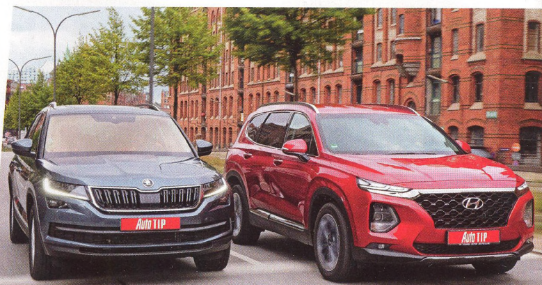
Škoda Kodiaq vs. Hyundai Santa Fe

V típech na výlet expozice v německém Herne..... 73