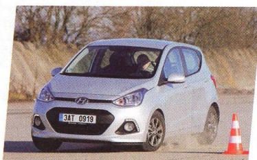
Bazar: Hyundai i10