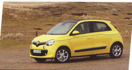
Renault Twingo po 100 000 km