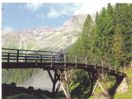
24 NA KOLE I S KOLEM (NEJEN PO ALPÁCH) Brennerský hraniční hřeben