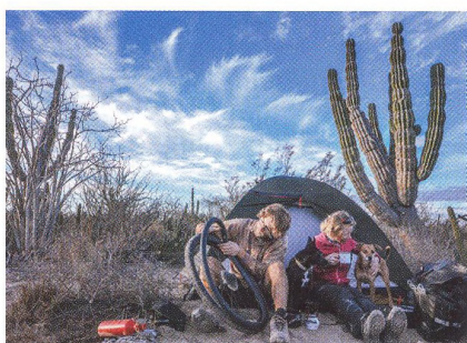
32 ROZHOVOR Americké dobrodružství se psy