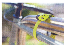
52 NETRADIČNÍ ZÁMKY Specifická ochrana