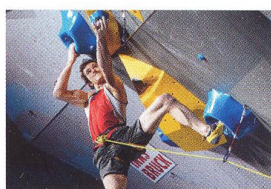
60 Z JINÉHO POHLEDU Adam Ondra Nejlepší lezec světa si oblíbil skládačku