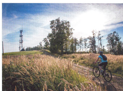
38 DOMÁCÍ CYKLOTRASA Palkovické hůrky Beskydský ráj kousek za Ostravou