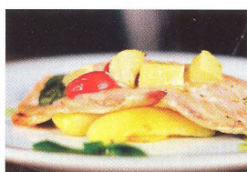
48 SPRÁVNÁ VÝŽIVA – SKRYTÝ MOTOR NA KOLE Na kole po šedesátce