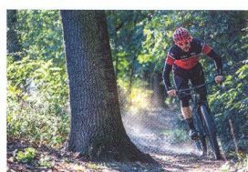
66 MĚSÍC V MĚSTSKÉM PROVOZU Specialized Chisel – hliník není mrtev