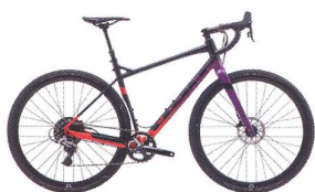
56 GRAVEL BIKE Ideální kolo na cesty?