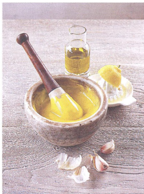
72. DIPY; OMÁČKY & DRESINKY