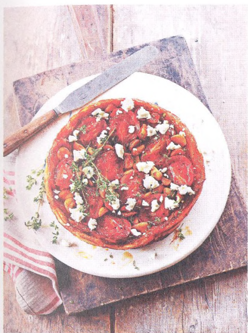
52. HLAVNÍ JÍDLA