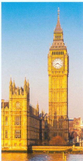
Věž Elizabeth Tower, známá jako Big Ben, a budovy parlamentu (viz str. 78)

A WORLD OF IDEAS: SEE ALL THERE IS TO KNOW www.dk.com