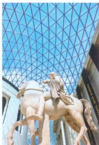
Římská socha na Velkém nádvoří v Britském muzeu (viz str. 128–31)