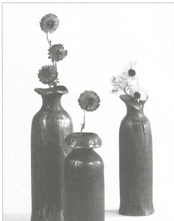
Fotodoprovod čísla - Z tvorby Jana Odvárky