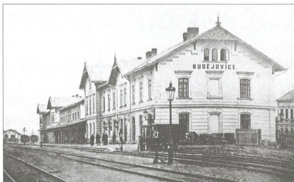
Původní nádražní budova počátkem 20. století