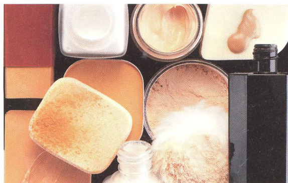
Abeceda pěstění pleti, protože make-up vypadá dobře jen na hezké pleti.