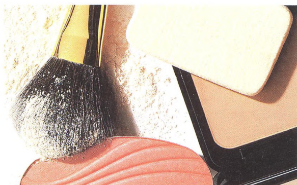
Čtyři základní naličení, demonstrována krok za krokem.