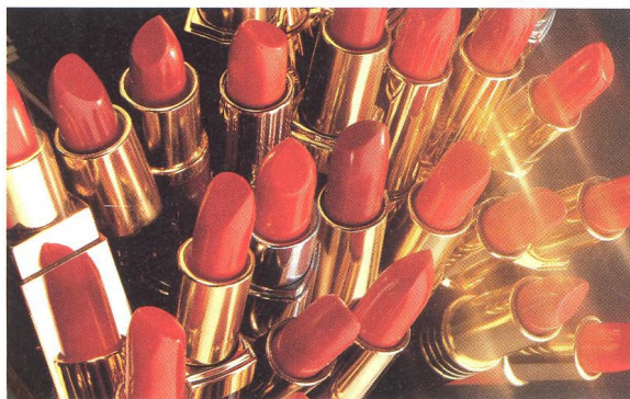
Všechno o výrobcích pro make-up a jak se správně používají.