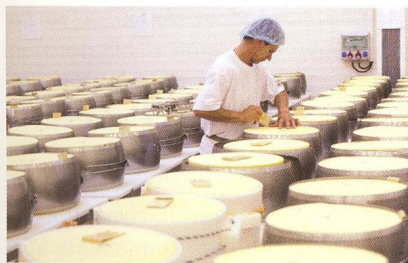
Originální receptura i značka sklízí vavříny doma i ve světě (str. 40)