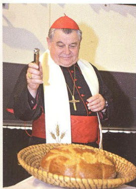
Soutěž o Chléb roku 2014 má své vítěze (str. 30)