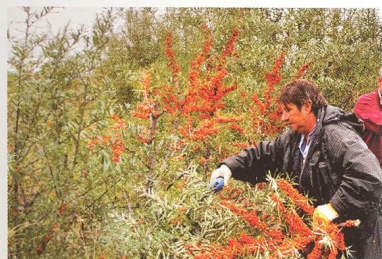
Rakytík rešetliakovitý ako preventívny liek (str. 78)