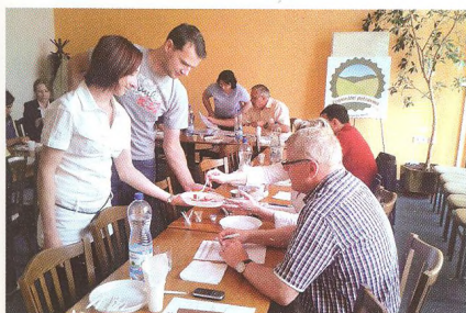
KLASA, Regionální potravina (str. 14 -26)