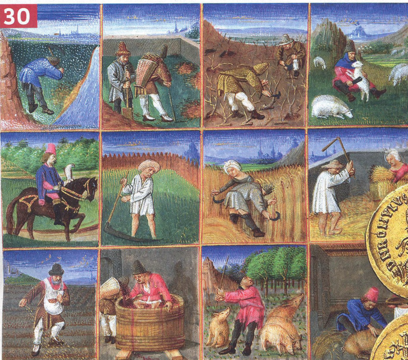
⬆ Kalendář polních prací na iluminaci z 15. století