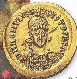
➤ Solidus Romula Augusta, posledního západorímského císaře (475–476)