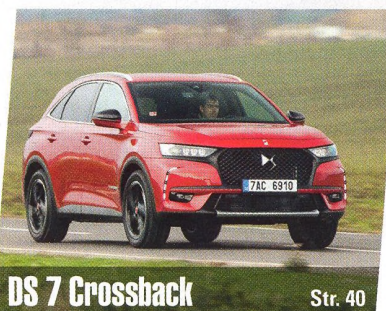
DS 7 Crossback