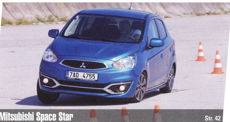
Mitsubishi Space Star