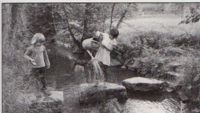
49| Lesní školka? Najdi deset rozdílů! Dětský klub Šárýnka, foto: Ekodomov.