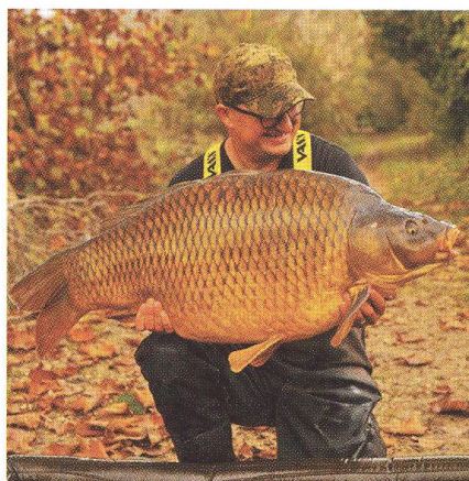
18 Bezpečné chytání / na nebezpečných místech