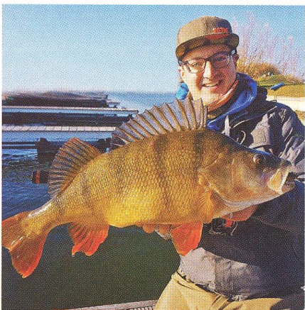
22 Otázka hlavy?!