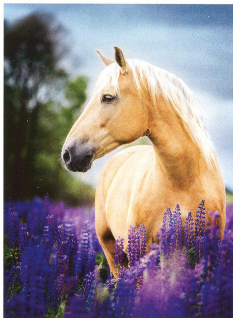
Foto na titulní straně: Shutterstock.com Plakáty: obojí Shutterstock.com

Horale bývají stejně drsní a svérázní jako příroda hor, ve které žijí – krásná, ale tvrdá a náročná. A horští koně jsou stejně jako horale otiskem svého prostředí.