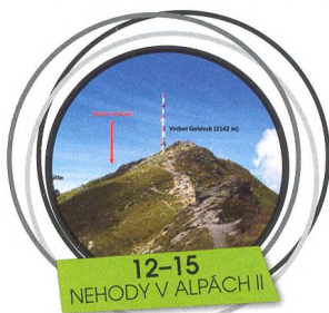
12-15 NEHODY V ALPÁCH II