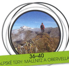
36-40 ALPSKÉ TÚRY: MALLNITZ A OBERVELLACH