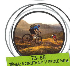
73-85 TÉMA: KORUTANY V SEDLE MTB