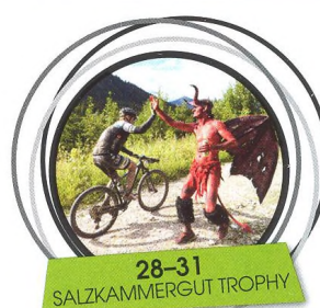
28-31 SALZKAMMERGUT TROPHY