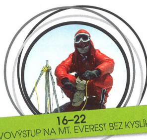
16-22 PRVOVÝSTUP NA MT. EVEREST BEZ KYSLÍKU