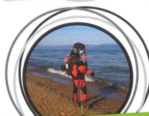
55–58 PŘECHOD NEJVĚTŠÍHO OSTROVA BAJKALU