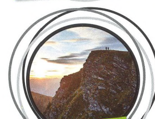
71–86 TÉMA: SAALBACH