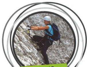
42–45 KARNSKÉ ALPY