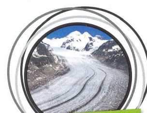
36–40 TO NEJLEPŠÍ ZE ŠVÝCARSKA