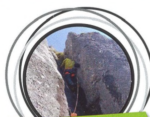
32–34 DIVOKÉ OKURKY V TOTES GEBIRGE