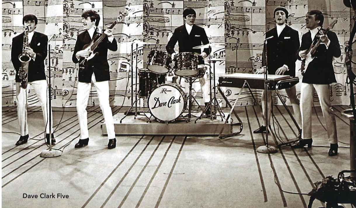
Dave Clark Five

80 Four Tops Čtyři hroty detroitské líhně.