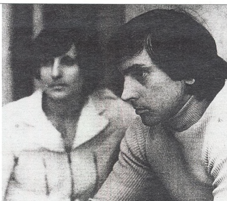
IVAN HLINKA hokejista

„Kovy bylo zapotřebí pomoci kamene filozofů uzdravit. A když se dají uzdravit kovy, proč by se neuzdravili lidé?“