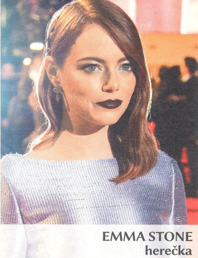
EMMA STONE herečka