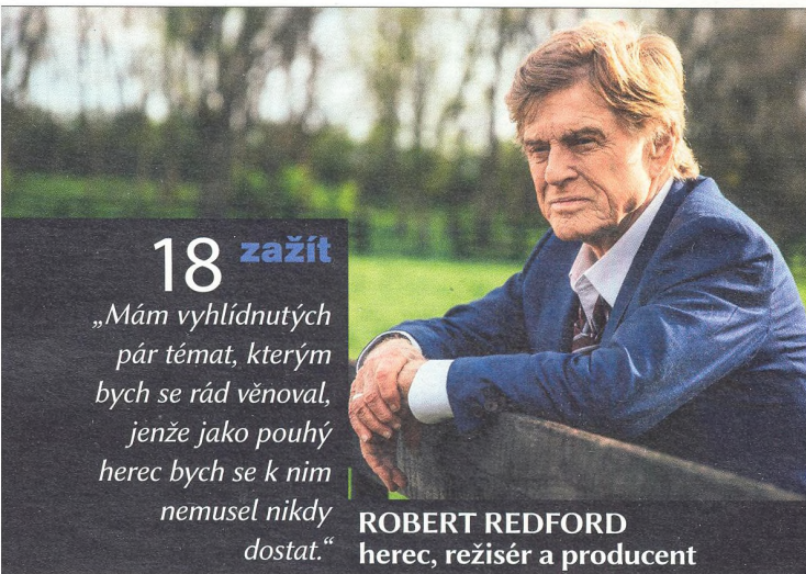
ROBERT REDFORD herec, režisér a producent

„Muž se cítí s přírodou spojený, žena je příroda. Zřejmě všechna moje díla jsou jaksi erotická.“