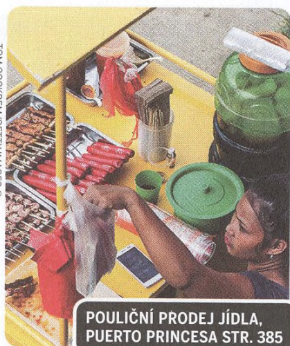
POULIČNÍ PRODEJ JÍDLA, PUERTO PRINCESA STR. 385