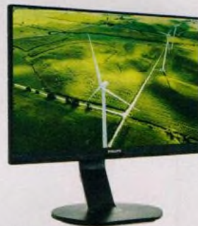
Vyberte si správný monitor (str. 20–23)