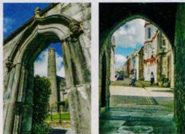
Rady a tipy, jak lépe fotografovat (str. 12–18)