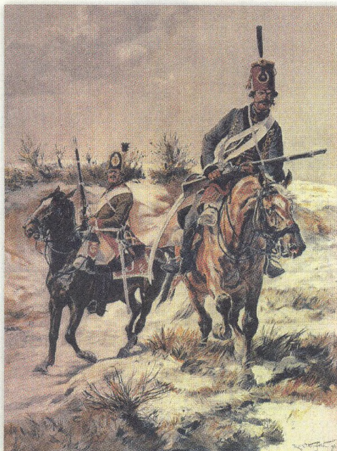
◀ Rakouské lehké jezdectvo, švališer a husar, na jehož bedrech leželo vedení „malé války“ především (str. 34)

Syn sedláka Hans Kudlich se v září roku 1848 zasadil o zrušení poddanství, roboty a desátku, ale znáte další osudy tohoto rodáka z rakouského Slezska?