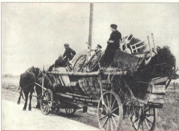
↑ Uprchlíci ze zabraného českého pohraničí směřují na podzim 1938 do vnitrozemí (str. 12)