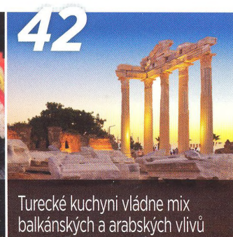
42 Turecké kuchyni vládne mix balkánských a arabských vlivů