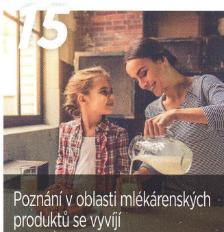
15 Poznání v oblasti mlékárenských produktů se vyvíjí