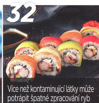
32 Více než kontaminující látky může potrápít špatné zpracování ryb