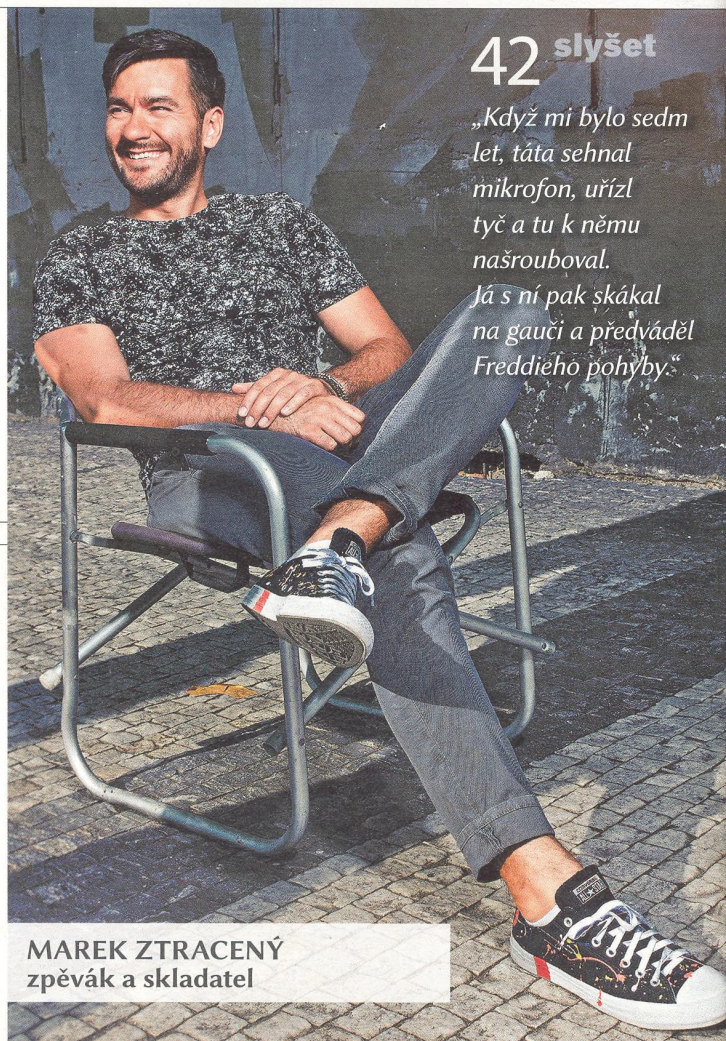
MAREK ZTRACENÝ zpěvák a skladatel

„Rozhodl jsem se neoslovit žádnou nespokojenou služebnou, která na Blízkém východě ještě pracuje, protože jsem se bál, že bych tím ohrozil její život.“