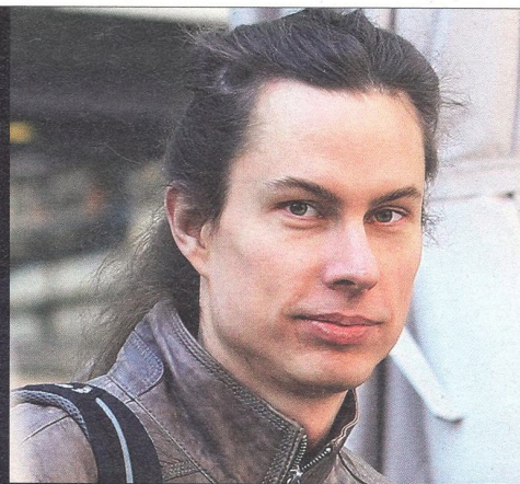
TOMÁŠ MIKOLOV odborník na umělou inteligenci

„Z evoluce je zřejmé, že člověk potřebuje zkoumat nové a nové věci. Jsme prostě zvědaví a já třeba věřím, že pokud vyřešíme všechny problémy dneška, vymyslíme nové.“