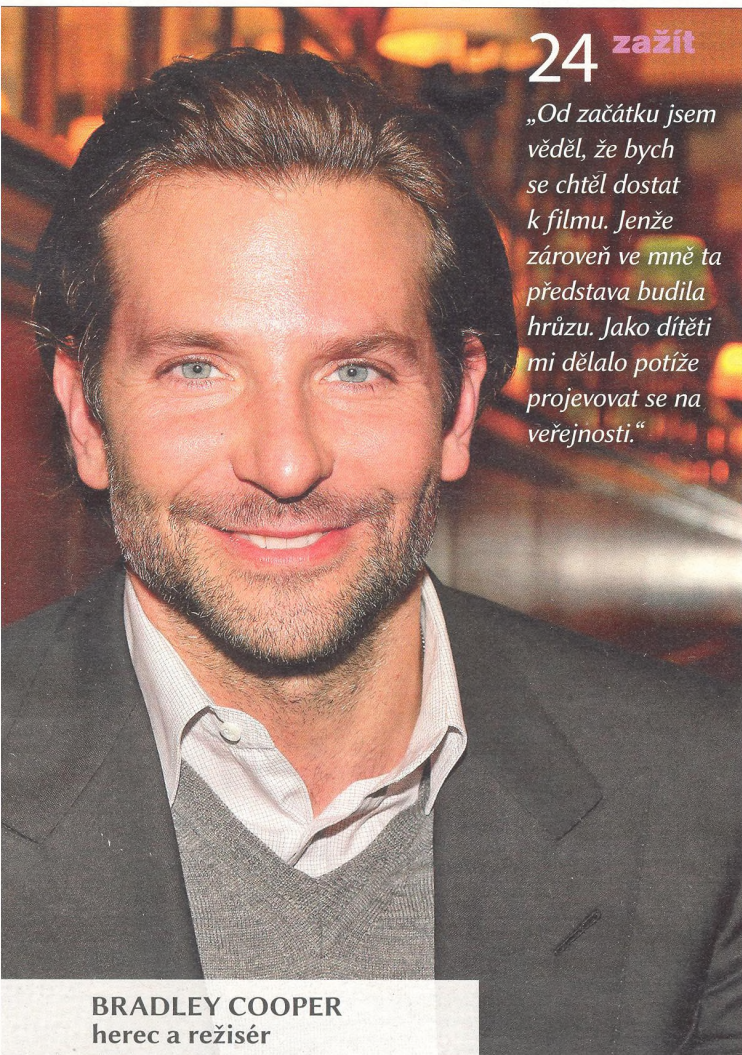
BRADLEY COOPER herec a režisér

„Tou dobou, kdy jsem začala půjčovat svůj gauč, jsem už byla nevidomá a cítila se doma v Čerčanech velmi osamělá.“