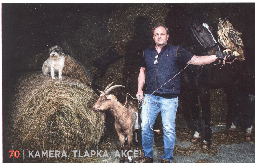
70 | KAMERA, TLAPKA, AKCE!