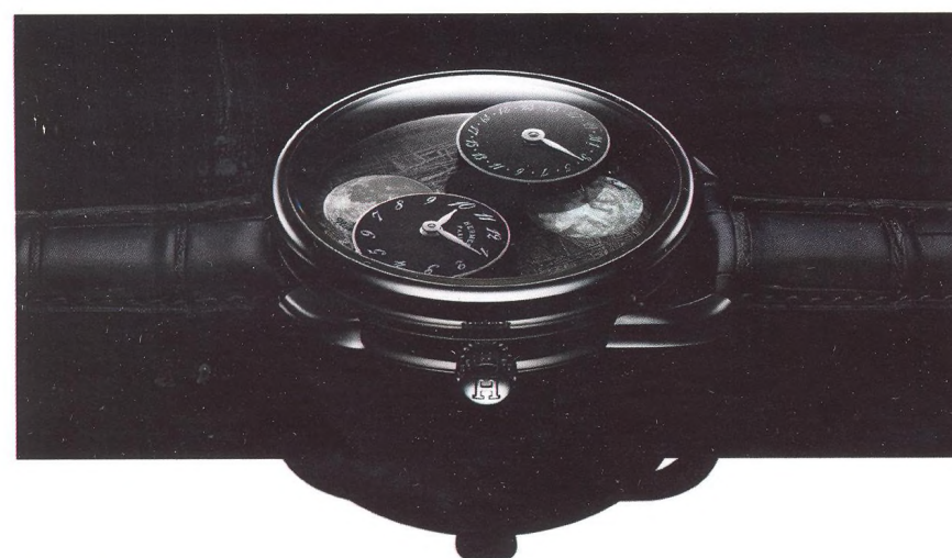
132 | NEJLEPŠÍ HODINKY 2019

34 | KOUSAT, NEBO ROZPUSTIT? ZUZANA KRAJÍČKOVÁ Výběr nejlepších českých čokoládoven, které vyrábějí metodou bean to bar.