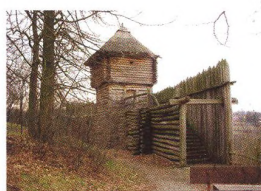
52 VÝLETNICKÝ PELMEL Obětní kámen, archeopark, hvězdárna a větrný mlýn