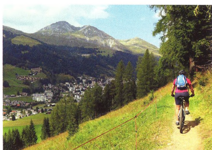
30 ZAHRAŇIČNÍ REGION Švýcarský Davos Klimatické lázně pod kouzelnými vrchy