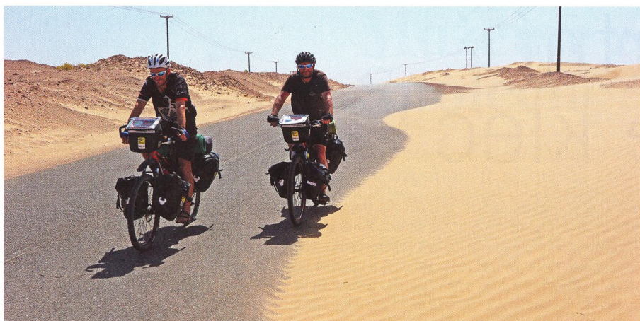
18 VELKÁ CESTA Omámení Ománem