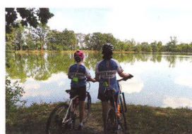
56 MALÝ VÝLET S DĚTMI Tovačov, Tovačov, tovačovský zámek...