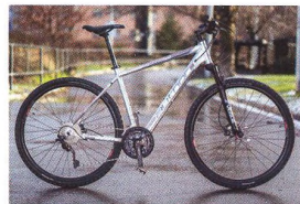
72 MĚSÍC V MĚSTSKÉM PROVOZU Author Codex – pěkně zlehka na hliníku