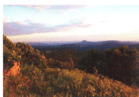
46 KOLEM VLASTI Trojmezí na Nise