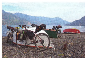
66 CESTOVNÍ KOLA ROKU 2019 Na „dunajskou“ nebo kolem světa