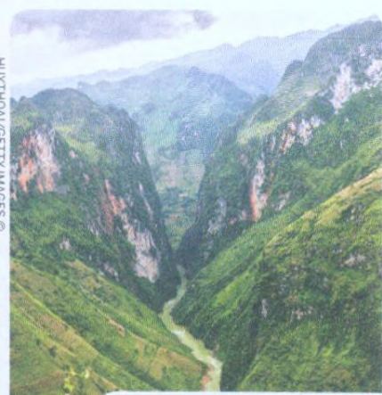
PROVINCIE HA GIANG STR. 141