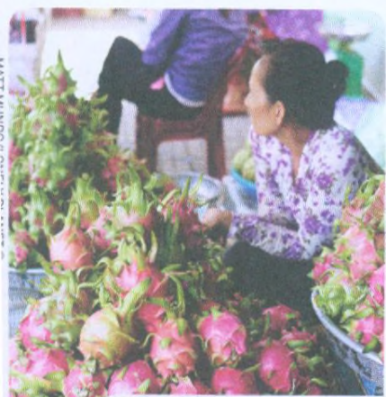
DRAČÍ OVOCE STR. 260