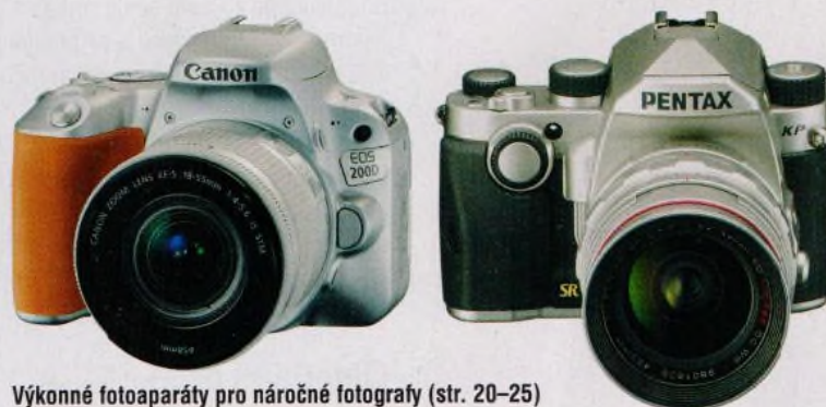
Výkonné fotoaparáty pro náročné fotografy (str. 20–25)