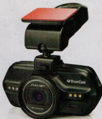
Autokamery – černé skříňky do auta (str. 14–18)