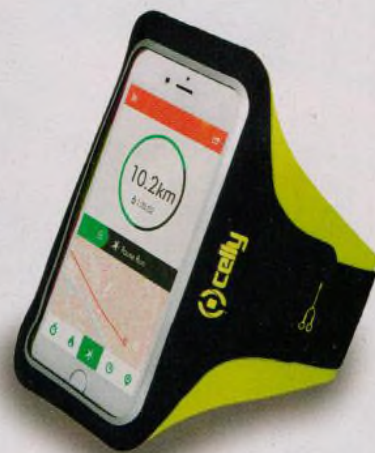
Doplňky a příslušenství k telefonu nejen na sport (str. 25–27)