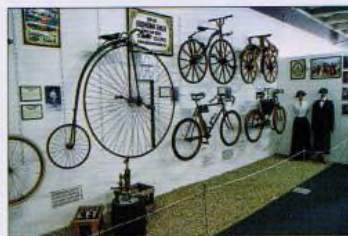
Pavel D. Vinklát

Nápadní denní motýli, kteří získali rodové jméno podle lesklých plošek na spodní straně křídel