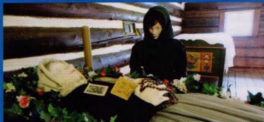
Nová expozice na Dlaskově statku/str. 18. a 19.