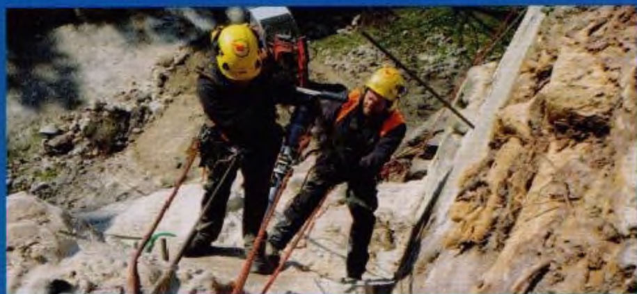
Přehled událostí/str. 4 -9.