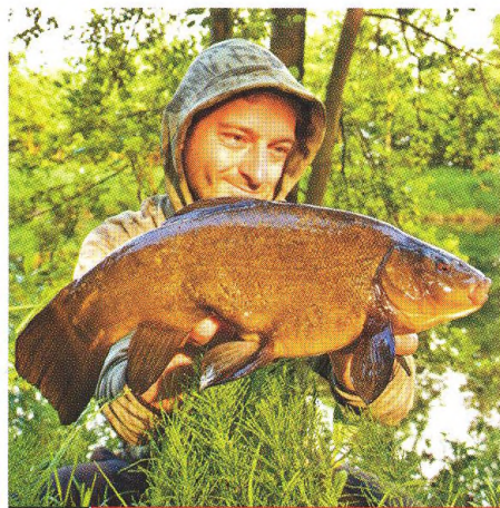
20 Cíleně na líný!