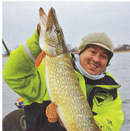
04 Na Rujánu s kajakem