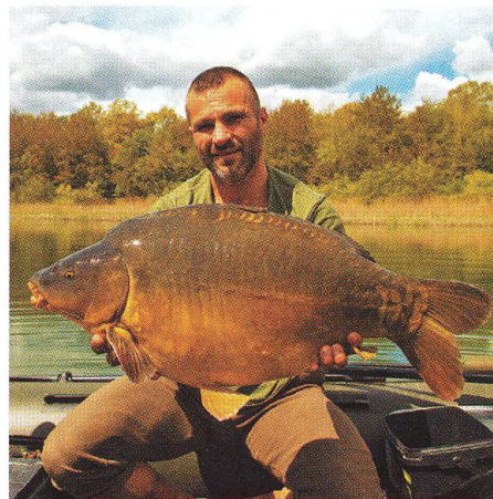
12 Toulání po zátokách