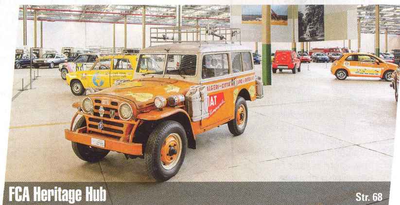
FCA Heritage Hub