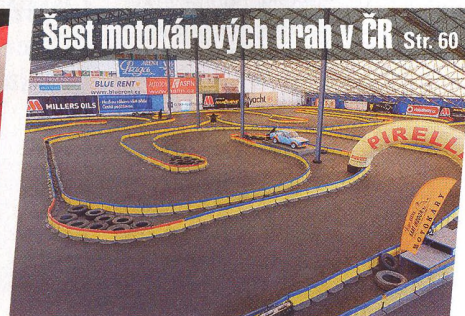
Šest motokárových drah v ČR