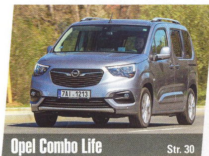
Opel Combo Life