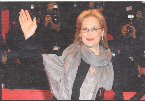
MERYL STREEP herečka

„Každý týden jsem tedy vstupovala do jiného světa, světa exotiky a světa svobody. O tom, že jsou homosexuálové, nepadlo nikdy ani slovo.“