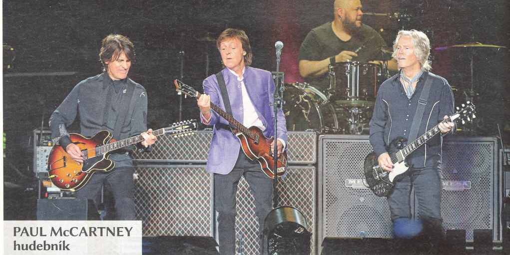
PAUL McCARTNEY hudebník

„Myslím si, že nad námi něco je. Měl jsem pár hluboce spirituálních zážitků, hlavně v mládí, když jsme ujížděli na drogách.“