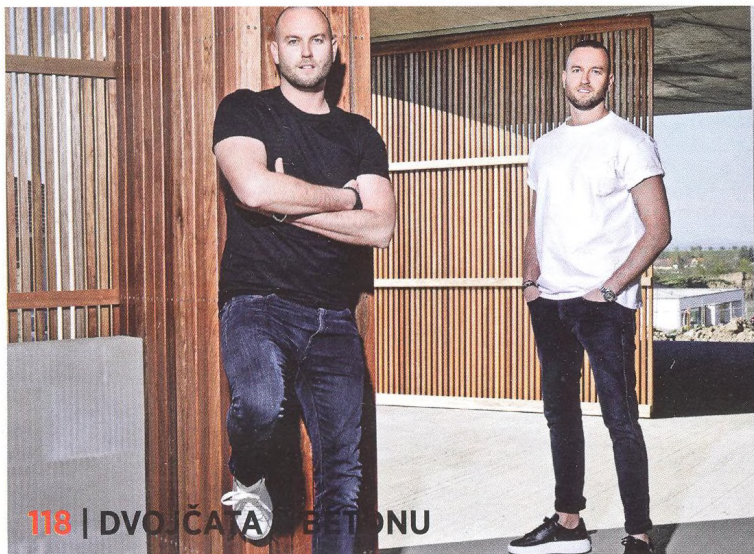
118 | DVOJČATA V BETONU