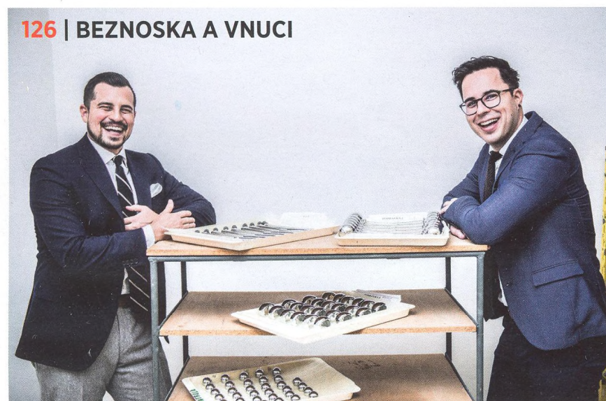
126 | BEZDOSKA A VNOCI