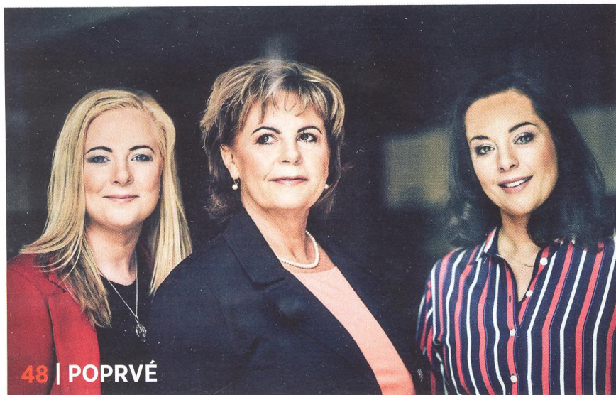
48 | POPRVÉ